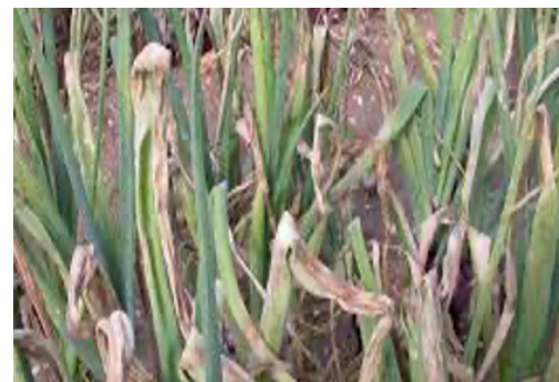
Falscher Mehltau in Zwiebeln

Squall® wird in Deutschland vertrieben durch SUMI AGRO Deutschland.