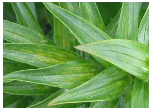
Virus in Lilien