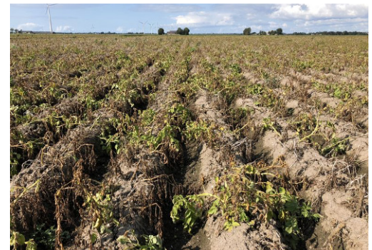
Krautabtötung in Kartoffeln

Andere Studien mit Squall® zeigen ähnliche Ergebnisse zur Wirkungsverbesserung. Die verbesserte Bedeckung zeigt auch einen positiven Effekt in der Pilzbekämpfung, unter anderem bei: Äpfeln, Zwiebeln und Zuckerrüben. Der vollständige Versuchsbericht kann unter www.Squall.de eingesehen und heruntergeladen werden.